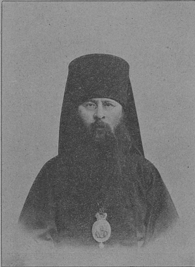
Высокопреосвященный Сергій, Архієпископъ Финляндскій и Выборгскій.