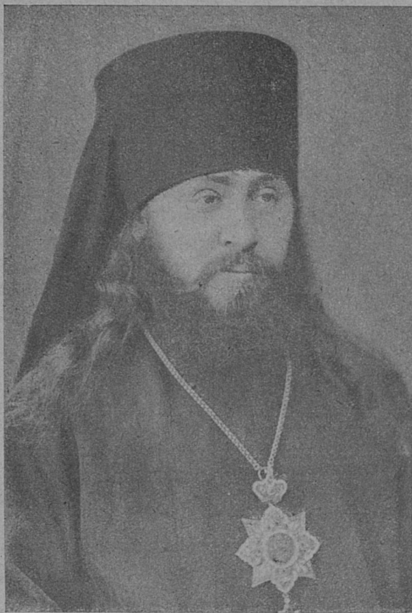
Преосвященнѣйшій Серафимъ, Епископъ Сердобольскій.