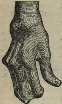
Искривленіе рукъ при хроническомъ суставномъ ревматизмѣ.

Всякій желающій получаетъ БЕЗПЛАТНО пакетъ содержащій ВѢРНОЕ СРЕДСТВО противъ РЕВМАТИЗМА или ПОДАГРЫ .