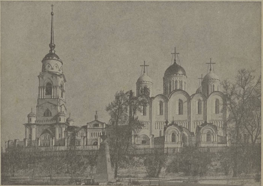
Губ. г. Владимиръ. Скоропечатня И. Коиль.