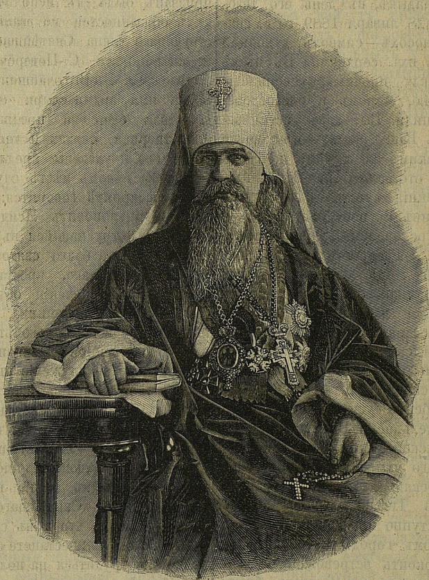
Высокопреосвященный митрополитъ Палладій.

что архипастырское дѣйствованіе ваше, проникнутое духомъ мира и любви, и здѣсь, какъ въ прежнихъ мѣстахъ важнаго служенія, успѣло снискать вамъ уваженіе и сыновнюю преданность разноплеменной паствы. Ревность ваша