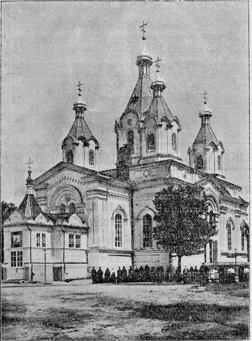
Тишениновский Боголюбский женский монастырь