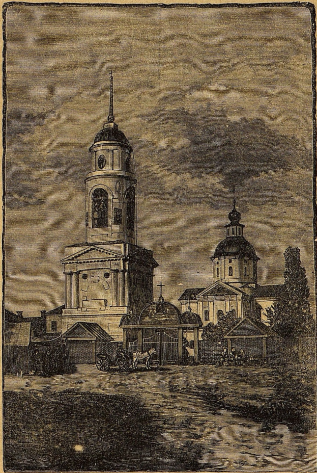
Самарскій Запорожскій монастырь (1782—1787 г.).

краѣ, такъ соборъ въ Новой Самари послѣдней церковью, по крайней мѣрѣ, послѣдней какъ по своей превосходной отдѣлкѣ, такъ и по своему долговременному, больше чѣмъ столѣтнему со времени паденія Запорожья, существованію. До построенія знаменитаго собора въ Новой Самари была деревянная церковь, передѣланная изъ простой хаты послѣ