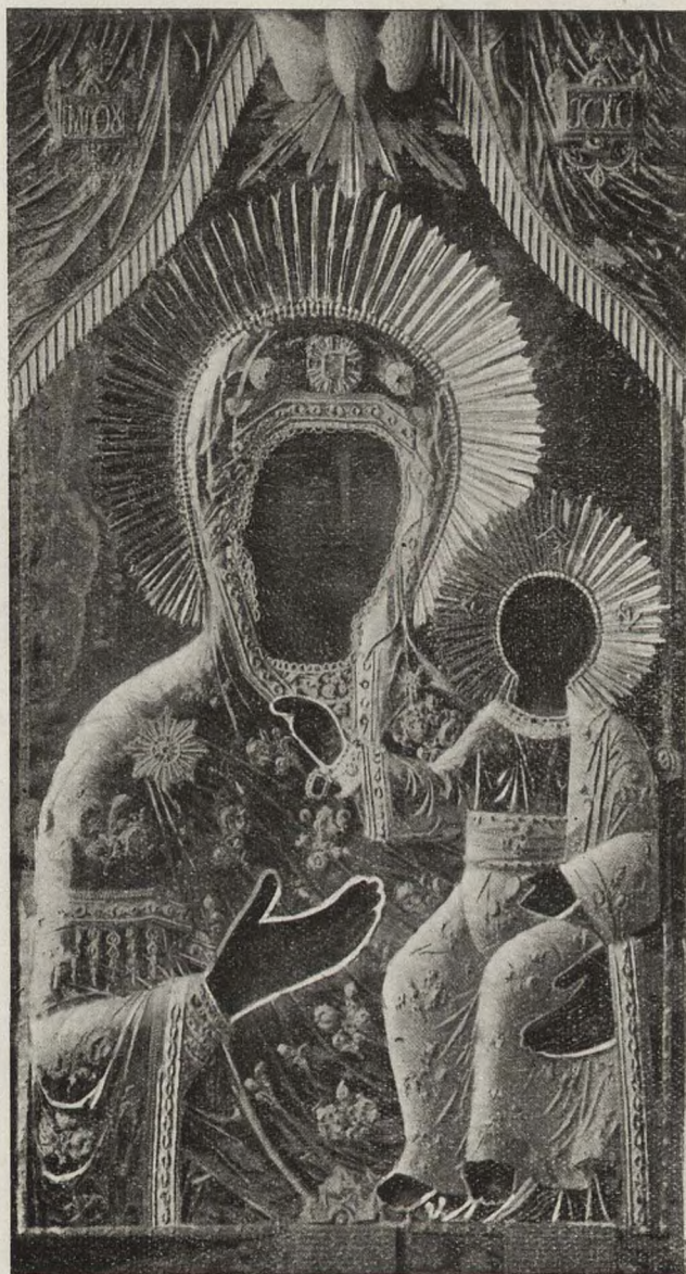
Смоленская Надворотная икона Божіей Матери—Одигитріи, сопутствовавшая русскимъ войскамъ въ 1812 г.