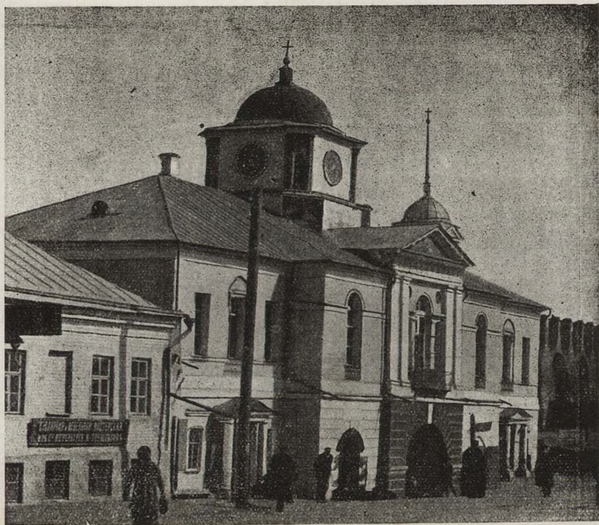
Богоматерская церковь—съ южной стороны.