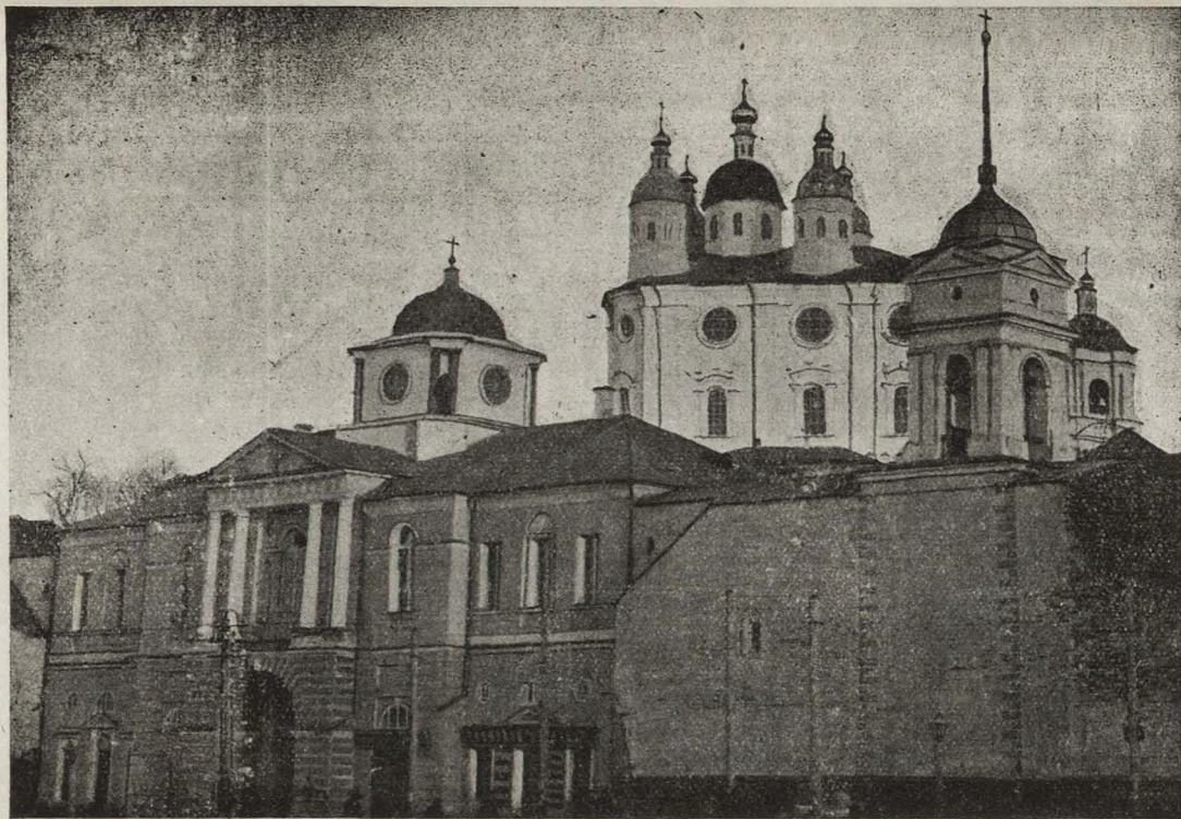
Богоматерская церковь со стороны Днѣпра;—надъ воротами между четырехъ колонъ—балконъ, съ котораго Наполеонъ навелъ 6 августа пушки по русской батарее Нилуса.