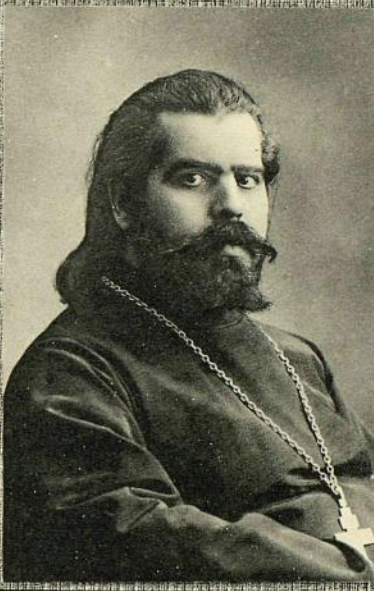
от И.И. ТЕТЕУКІЯ