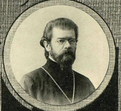
от К.К. ВОЛКОВЪ