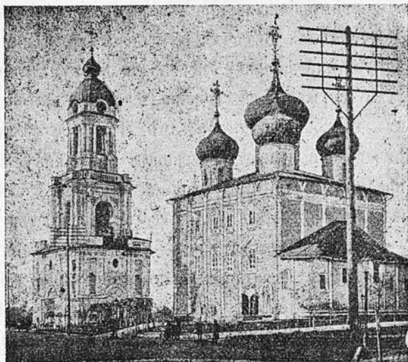
Тверской кафедральный соборъ.

Выходятъ еженедѣльно по понедѣльникамъ. годовая цѣна: Безъ пересылки 4 р. 50 к. Съ пересылкою 5 р. 50 к.