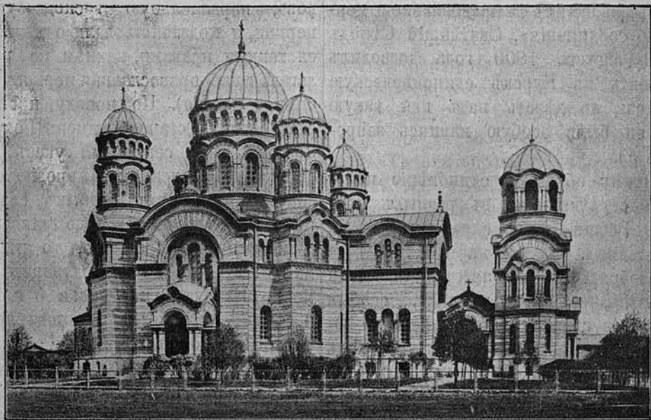
Каедральный соборъ въ Ригѣ.

предь Министерствомъ Внутреннихъ Дѣлъ, въ концѣ декабря 1875 года Высочайше отпущены были средства изъ Государственнаго Казначейства на сооруженіе новаго каедрального собора въ г. Ригѣ. Постройка соборнаго храма продолжалась около 8 лѣтъ. Заложенный 3 іюня 1876 года, новый каедральный соборъ торжественно былъ освященъ 28 октября 1884 года во имя Рождества Христа Спасителя.