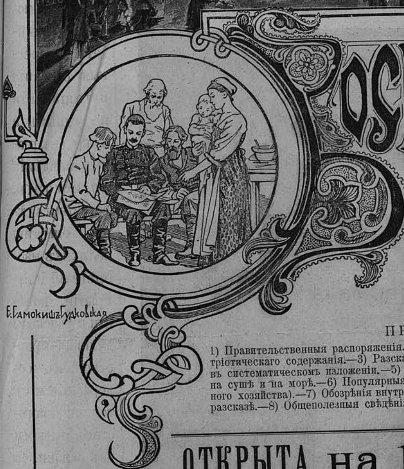
Б. Гамокиш Гудковская