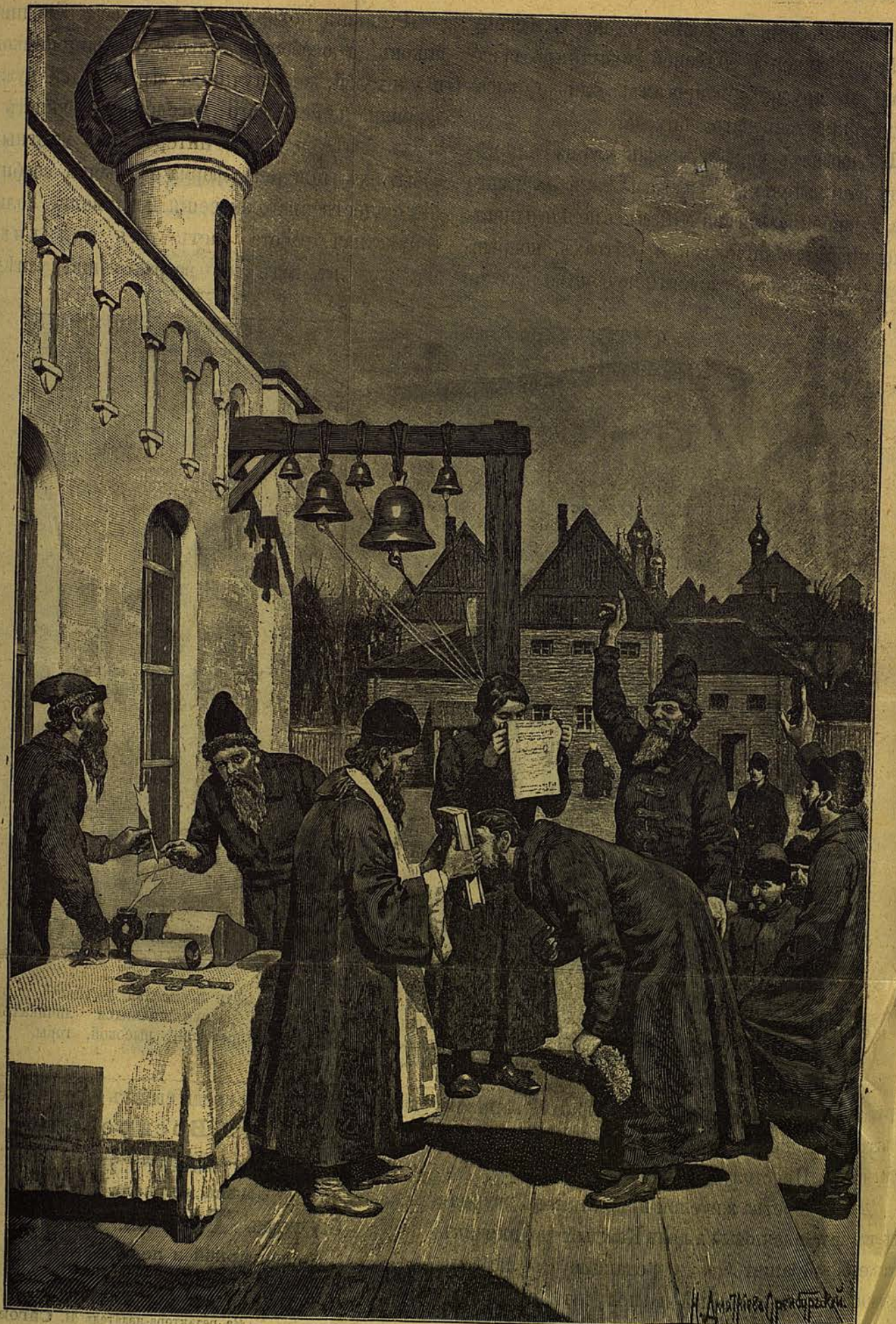
Присяга въ Москвѣ въ XV вѣкѣ. См. № 24 жур. «Воскресеніе» 1900 г.