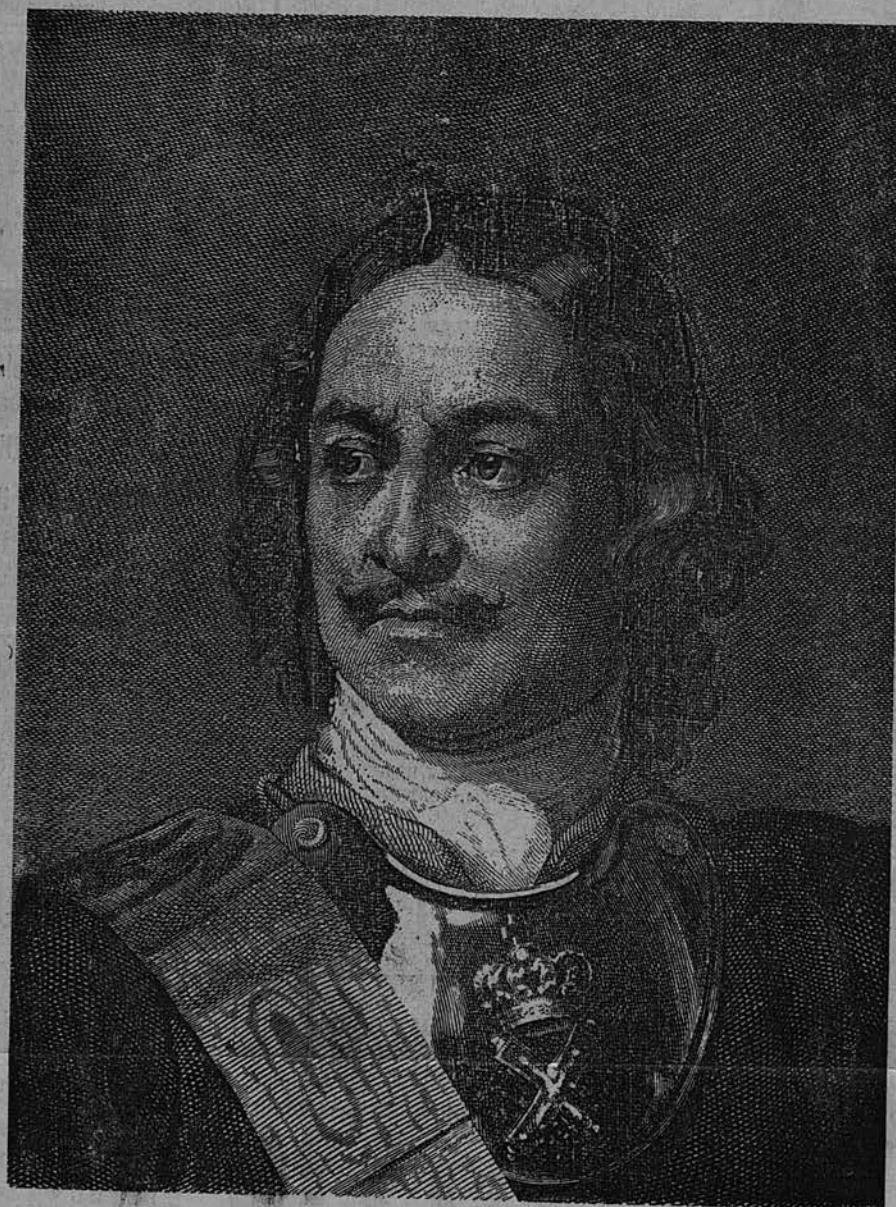
Императоръ Петръ Великій. Геніальный Преобразователь Руси. См. № 6 жур. «Воскресеніе» 1900 г.

озаботилась пріобрѣтеніемъ соотвѣтствующаго литературнаго матеріала, такъ что въ продолженіе 1901 г. дасть своимъ читателямъ рядъ повѣстей, рассказовъ, очерковъ старины, біографій знаменитыхъ отечественныхъ и иностранныхъ дѣятелей, путешествій, полезныхъ и интересныхъ статей, посвященныхъ самымъ разнообразнымъ вопросамъ, интересныхъ анекдотовъ, шутокъ, загадокъ,