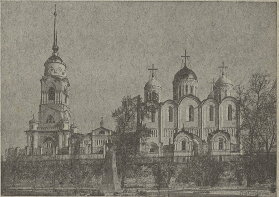
Губ. г. Владиміръ СКОРОПЕЧАТНЯ И. КОИЛЬ.