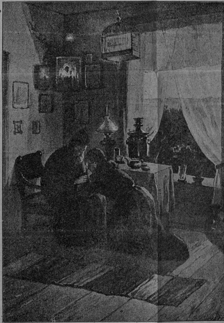
Духовное утѣшеніе страдальца.

12 КНИГЪ ЕЖЕМѢСЯЧН. ПРИЛОЖЕНІЙ до 2,000 стран. БОЛЬШОГО ФОРМ. ПОЛНОЕ СОБРАНІЕ ЖИТІЙ СВЯТЫХЪ ПРАВОСЛАВНОЙ ГРЕКО-РОССІЙСКОЙ ЦЕРКВИ, подъ редакціей и при ближайшемъ участіи Е. Поселянина. Полное изданіе въ теченіе одного 1908 года