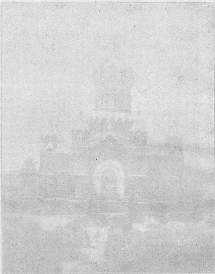
Соборный храм въ Николаевскомъ Владимирскомъ монастырѣ.