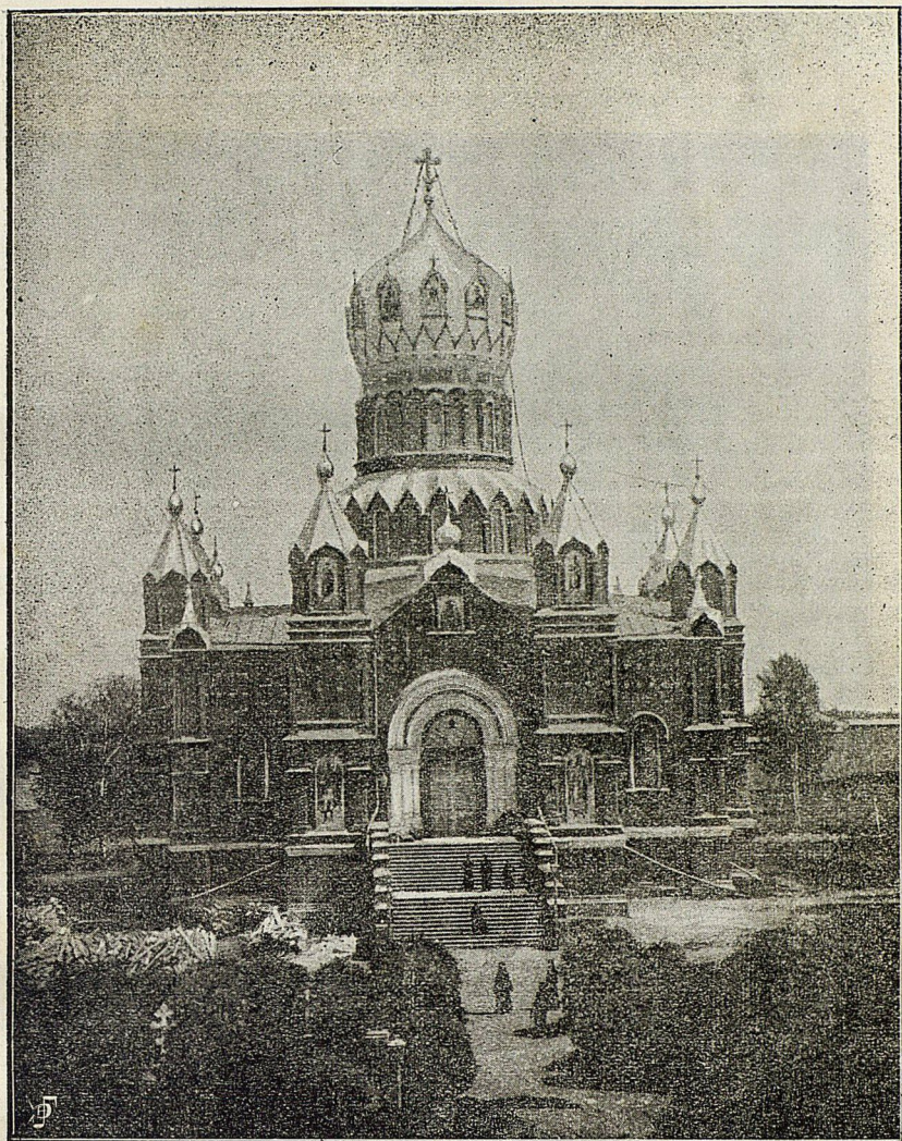
Соборный храм въ Николаевскомъ Бабаевскомъ монастырѣ.

Соборный храмъ въ Николаевскомъ Бабаевскомъ монастырѣ. (Издание въ старомъ форматѣ)