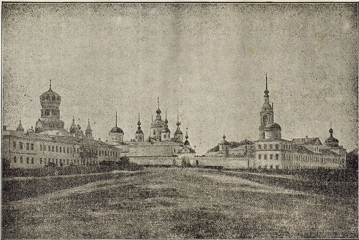
Николаевскій Бабаевскій монастирь.