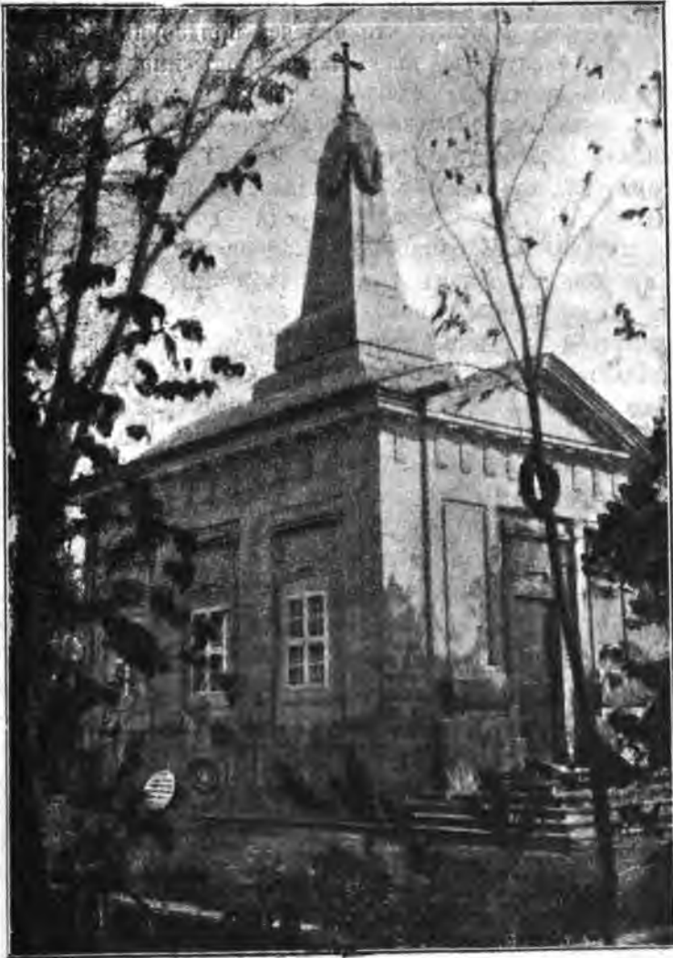
Надгробный храмъ въ Ирѣмѣ.

который долженъ быть воздвигнуть надъ ея гробомъ». Второе предположеніе вызвало серьезный ропотъ среди венгерскаго народа, и было оставлено безъ возраженій. Къ этому письму палатинъ присоединилъ начало духов-