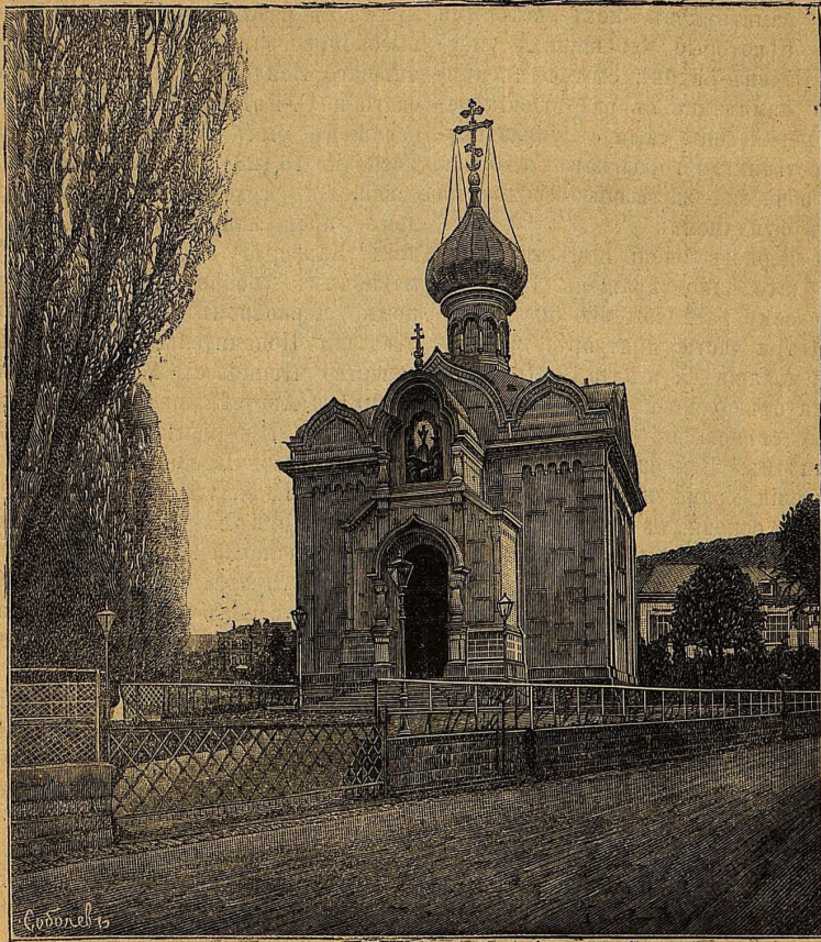
Храмъ Преображенія Господня въ Ваденъ-Ваденѣ.

Однимъ изъ лучшихъ и цѣнныхъ въ художественномъ отношеніи украшеній храма съ вѣншей его стороны служитъ храмовая мозаическій образъ Преображенія Господня, исполненный извѣстнымъ венеціанскимъ художникомъ г. Сальвиати по рисунку князя Г. Г. Гагарина и помѣщенный на фронто́нѣ надъ главною