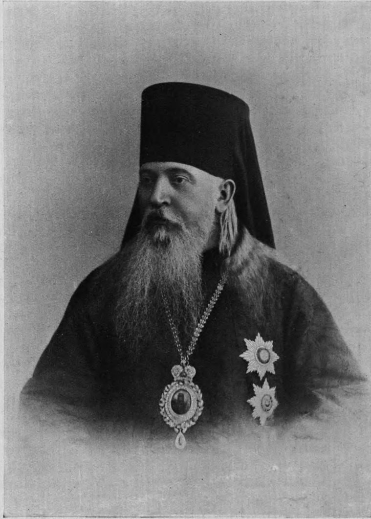
Высокопреосвященнѣйшій Агафангелъ, АРХІЕПИСКОПЪ ЛИТОВСКІЙ и ВИЛЕНСКІЙ.