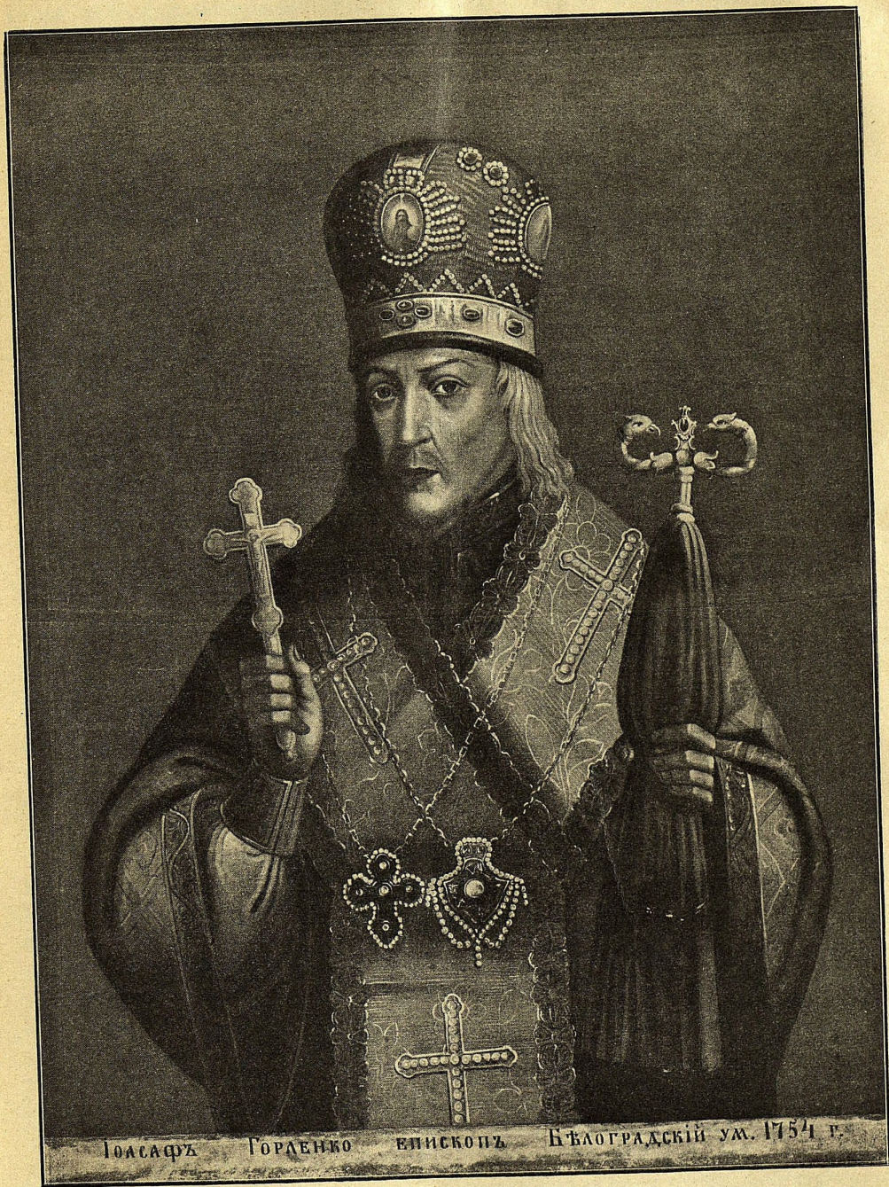
Гюсафъ Горденко епископъ Бѣлоградскій ум. 1754 г.

Воспроизведеніе портрета, находящагося въ конференцъ-залѣ Кіевской духовной академіи.