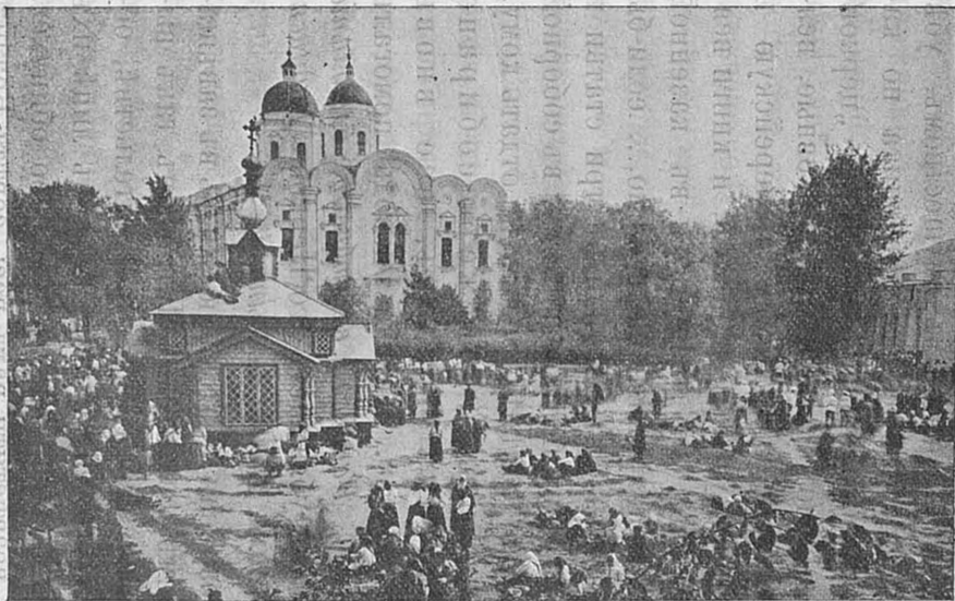
Соборный храмъ, въ которомъ почиваютъ мощи св. Митрофана, въ Воронежскомъ Благовѣщенскомъ Митрофановомъ монастырѣ.