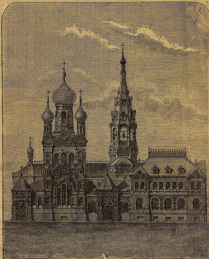
Храмъ Святыя Живоначальныя Троицы на Николаевской улицѣ въ С.-Петербургѣ.