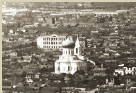
Фрагмент панорамного снимка Саратова, в центре – Крестовоздвиженский храм