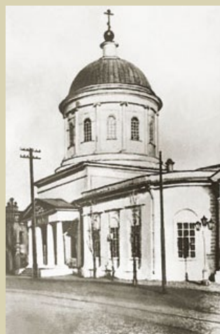
Нерукотворенно-Спасская церковь Вид с Волги