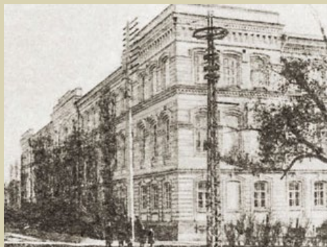
Саратовская Духовная семинария

2 ноября 1891 года Михаил Иванович был рукоположен епископом Саратовским и Царицынским Авраамием (Летницким, † 1893) во диакона к Троицкой церкви в городе Вольске и назначен учителем церковноприходской школы. 30 августа 1892 года он был рукоположен во священника к Михаило-Архангельской церкви в селе Волхонщина Петровского уезда Саратовской губернии. Его священническую хиротонию также совершил Преосвященный епископ Авраамий.