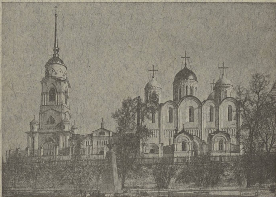
Губ. г. Владиміръ Скоропечатня И. Кошля.