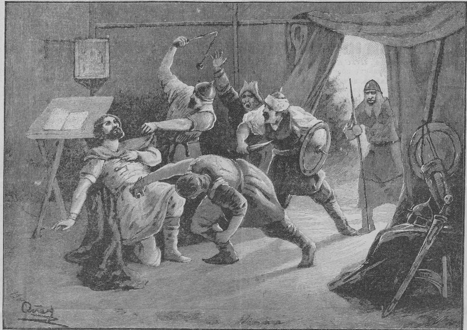
Убіеніе св. князя Бориса на берегу рѣки Альты въ 1015 году.

9) «Воззрѣть Нань, Егоже прободоша» . Картины изъ земной жизни Спасителя. М. Монлора . Авторъ этой книги уже извѣстенъ всѣмъ образованнымъ русскимъ читателямъ своими увлекательными повѣстями: «Свѣтъ міру» и «Послѣ 9-го часа». Съ какимъ одушевленіемъ и талантомъ пишетъ М. Монлоръ, какой счастливой способностью обладаетъ онъ переносить воображеніе читателя въ описываемую имъ эпоху, какъ широко захватываетъ онъ всю историческую сцену, на которой совершалась величайшая драма Голгофы,—это читатели знаютъ изъ указанныхъ повѣстей. Въ настоящей книгѣ съ тѣмъ же мастерствомъ разворачиваются еще новыя картины изъ той же незабвенной евангельской древности, на которыхъ ярко выступаютъ новыя штрихи Божественной Личности Спасителя.