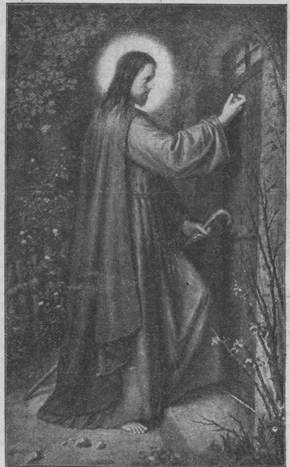
«Се, стою у двери и стучу». (Апокалипсисъ, III. 20).