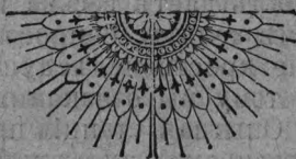
Тип. «Русскій Починъ».

Результаты опыта показали, что нѣтъ существенной разницы въ обоихъ способахъ откорма, поскольку это касается количества мяса. Телята обѣихъ группъ были проданы по одинаковой цѣнѣ, но откормленные снятымъ молокомъ обошлись дешевле. («Дерев. Хоз.»).