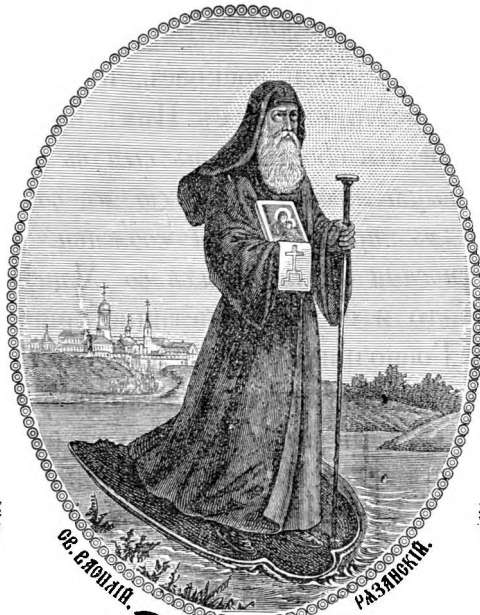
СВ. ВАДИМЪ. ПОРСОБАТЪСЯ. РЯЗАНСКИ.

Редакція проситъ духовенство и учителей присылать статьи по всѣмъ вопросамъ программы