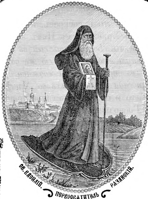
СВ. СЛОНЦА. ПЕРВОСВЯТИТЕЛЬ РАЗНЕНІЯ.

Редакція проситъ духовенство и учителей присылать статьи по всѣмъ вопросамъ программы,