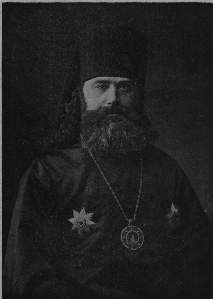
Высокопреосвященный Иннокентій, Экзархъ Грузіи, Архіепископъ Карталинскій и Кахетинскій.

(По поводу назначенія. См. статью № 1 „Вѣстн. Брат.“).