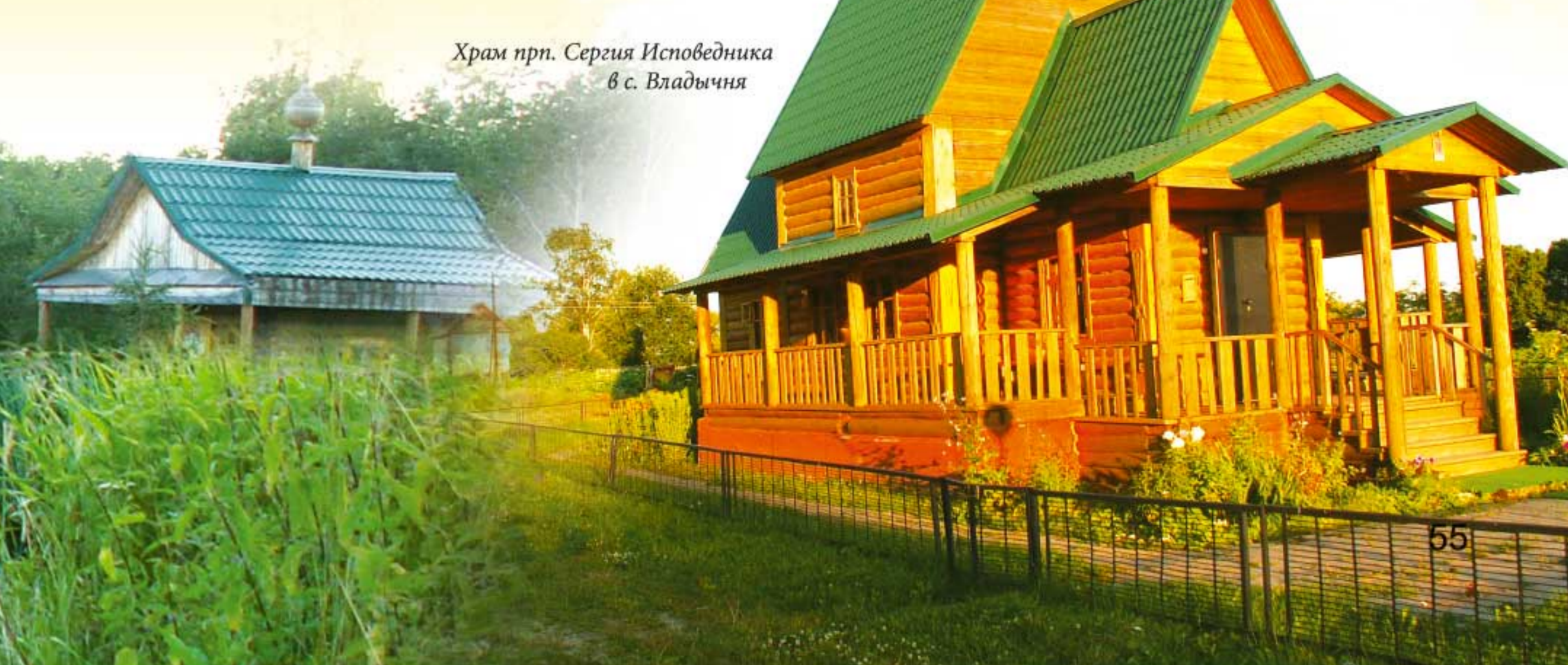
Храм прп. Сергея Исповедника в с. Владычня