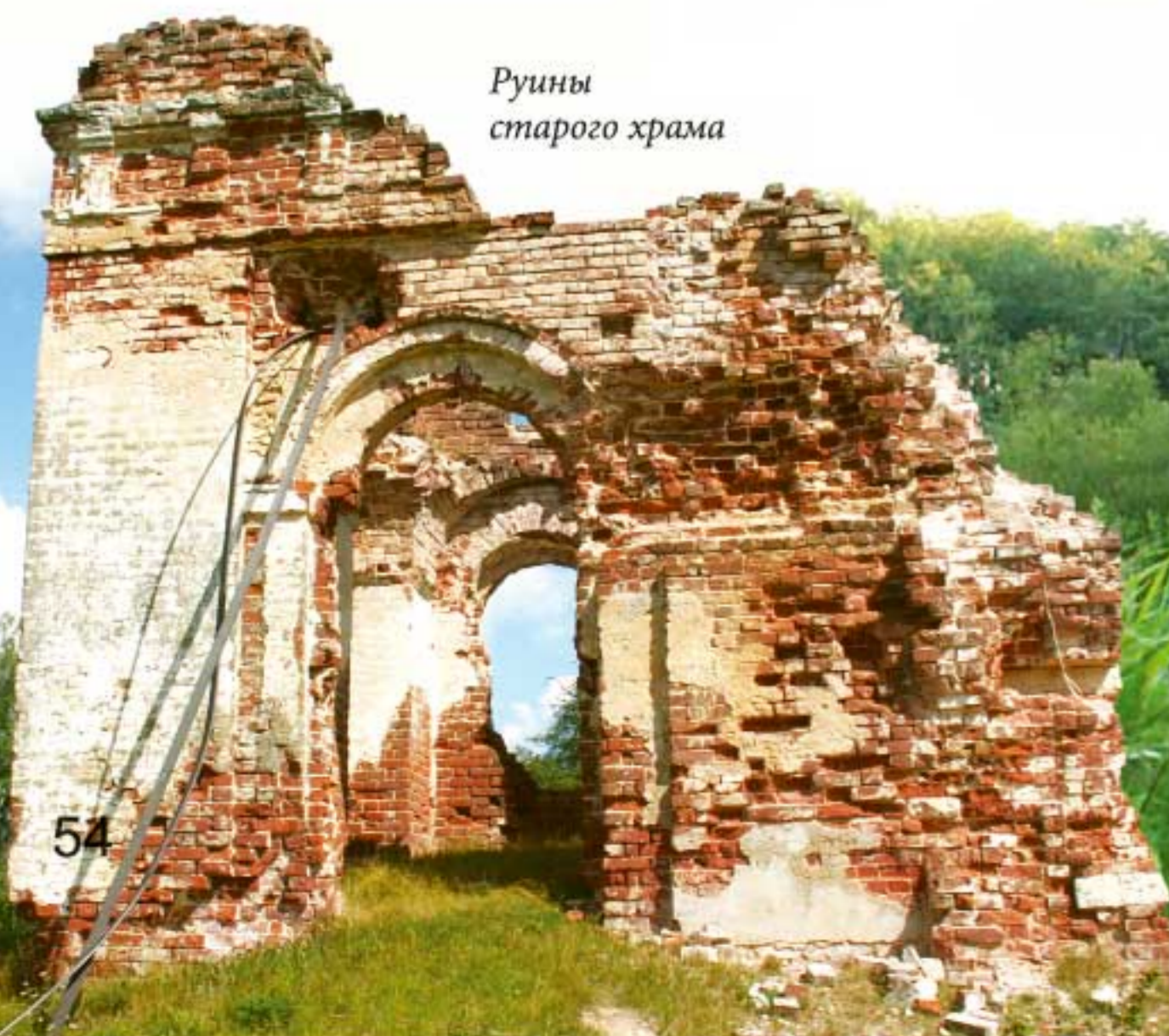
Руины старого храма