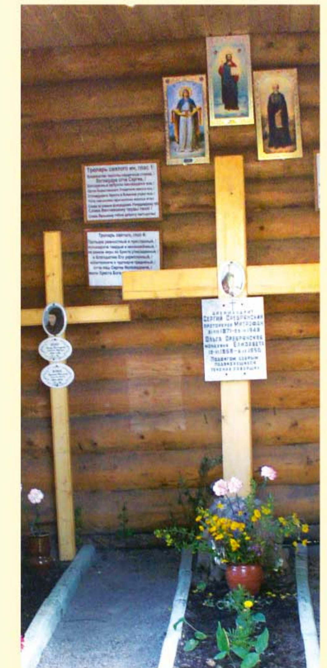
Могила Митрофана Сребрянского

Уезжать не хотелось. Так бы и сидели в роще или в поле среди цветов и думали о Боге и о вечном.