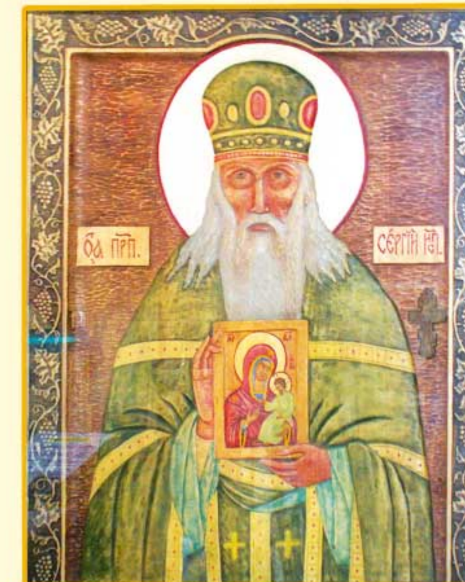
Резная икона прп. Сергея Исповедника (Митрофана Сребрянского) в храме в с. Владычня

огневая батарея. Прямо во двор дома свезли огромное количество оружия. Предстоял бой. В это время родственнику батюшки стало совсем плохо из-за его болезни. Он лежал уже при смерти и батюшка Митрофан пошел его навестить, несмотря на большую опасность и запрет хождения по селу. При приближении к дому батюшку окликнул майор НКВД: «Старик, ты куда?». «У меня тут родственник умирает в этом доме», - ответил Митрофан. «Ну, проходи». Через несколько дней Митрофан увидел, что оружие со двора куда-то увозят. Он спросил, что происходит. Майор сказал, что бой состоялся в 14 км. от этого места и пошутил: «Видно, здесь кто-то молится об этом месте». Другая история уже современная. Когда строили храм в селе, один из кровельщиков произнес: «Если батюшка Митрофан и вправду святой, то пусть пойдет снег». Был сентябрь, стояла теплая солнечная погода, но вдруг небо потемнело и полетели крупные хлопья снега. Снег покрыл землю и крышу храма. Вскоре снег прошел, снова засияло солнце, все растаяло.