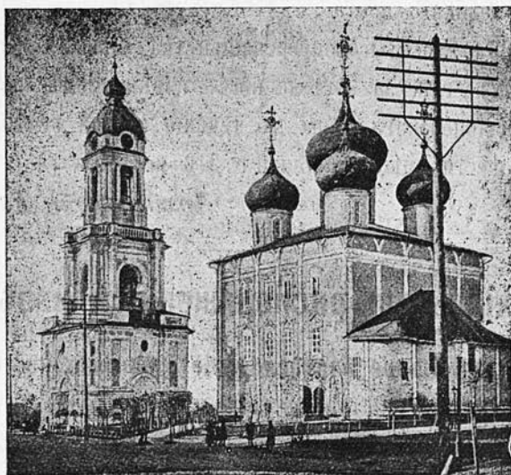
Тверской кафедральный соборъ.