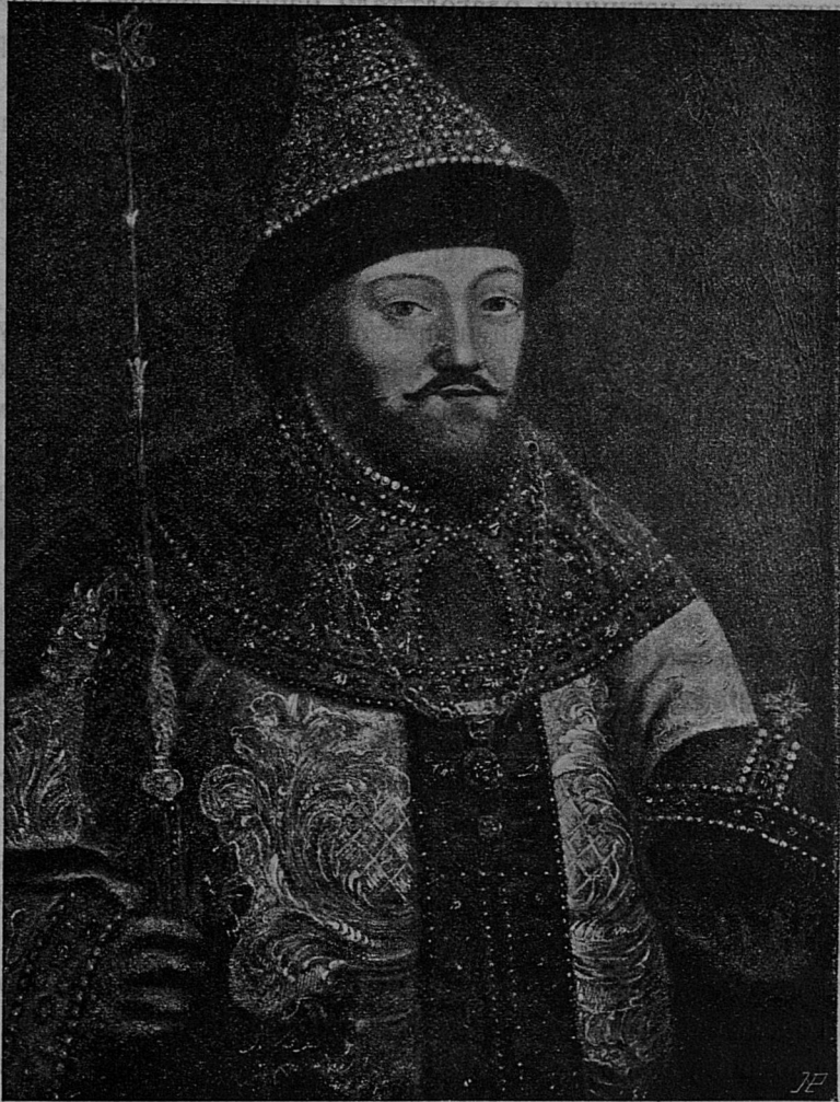
Царь Михаилъ Феодоровичъ Романовъ.