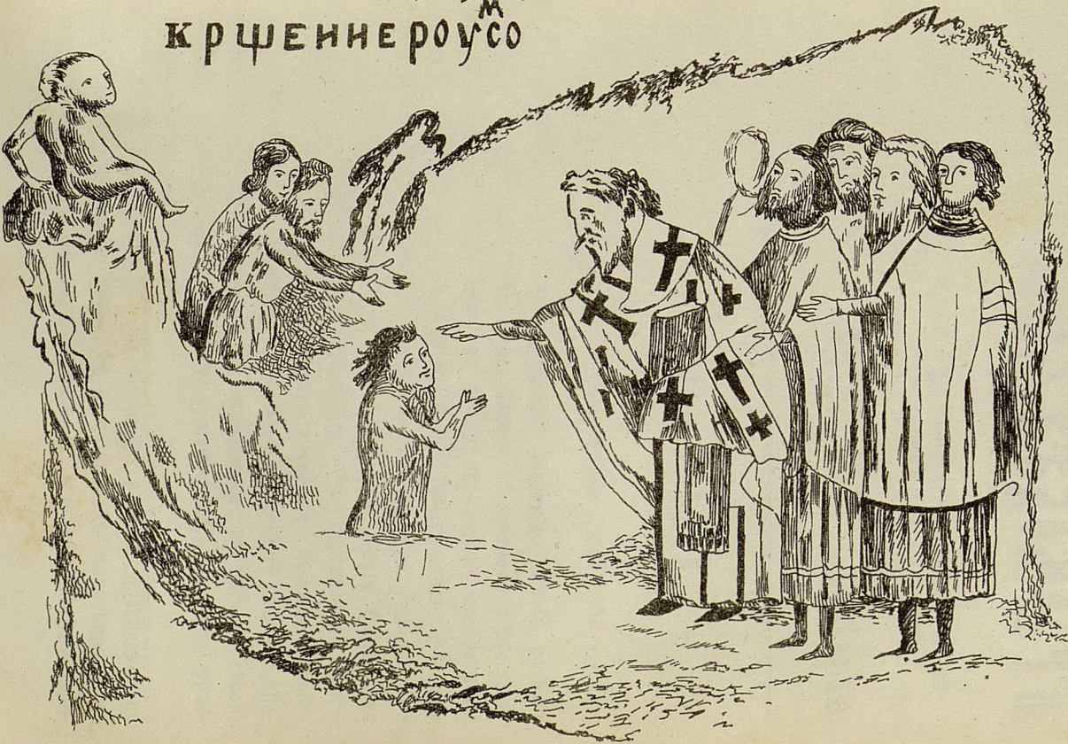
Рисунок VI-й при хранящейся въ Римѣ въ Ва- тиканской биб- ліотекѣ, славян- ской рукописи, со- ставляющей пе- реводъ греческой лѣтописи К. Ма- нассіи.

Видъ мѣстности, на которой крещены Русскіе при Аскольдѣ и Дирѣ въ 866 году.