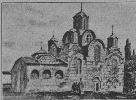
ТИПИЧНЫЙ ДРЕВНИЙ ХРАМЪ ВЪ СЕРБІИ.