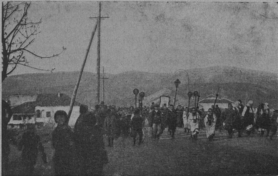
КРЕСТНЫЙ ХОДЪ ВЪ ДЕНЬ «СЛАВЫ».

Среди сербовъ прежде и теперь распространенъ благочестивый обычай путешествія во св. Гору и св. Землю. Тѣ, которые совершали это путешествіе, пользуются исключительнымъ уваженіемъ въ народѣ. Имъ усвоится весьма почетное имя хаджи . . . Въ настоящее время эти путешествія совершаются группами и напоминаютъ русскія богомольческія путешествія въ Кіевъ, Саровъ, на Афонъ и св. Землю. Иногда цѣлые города съ окрестностями участвуютъ въ такихъ путешествіяхъ.