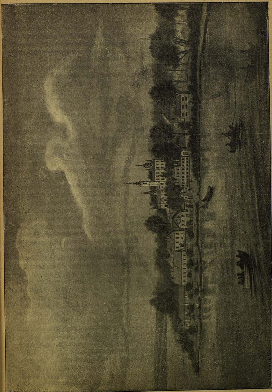
Видъ Черемнецкаго Іоанно-Богословскаго монастыря.