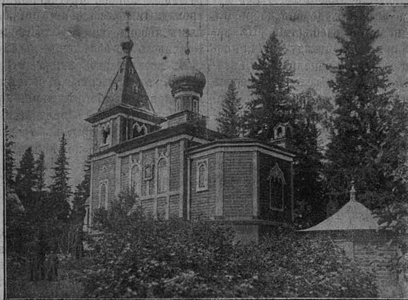
Предтеченскій скитъ на Валаамѣ.

Въ субботу, по окончаніи поздней литургіи и полуденной трапезы, на тѣхъ же судахъ повезли насъ въ Ко-