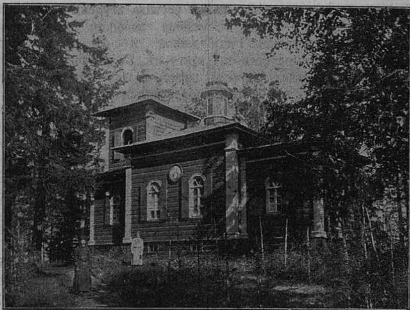
Скитъ преподобнаго Александра Свирскаго на Валаамѣ.