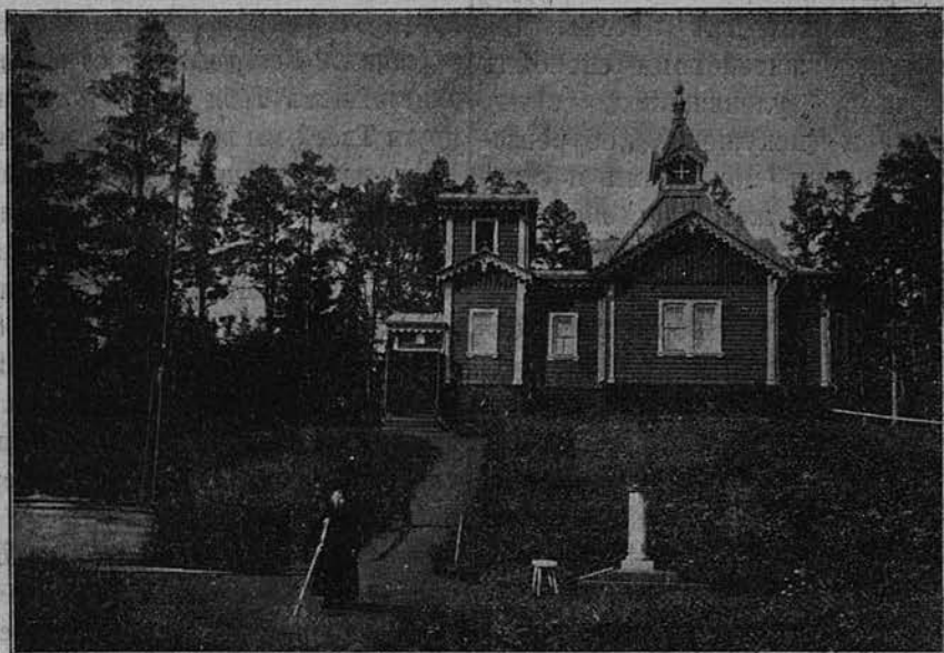
Ильинскій скитъ на Валаамѣ.

Обозрѣвъ все, что есть замѣчательнаго въ монастырѣ, и помолившись на святыхъ мѣстахъ его, мы стали собираться въ обратный путь, въ Петербургъ. Въ 1 часъ по полудни отслуженъ былъ въ Знаменской часовнѣ на паровой пристани общій напутственный молебенъ Божіей Матери и преподобнымъ Сергію и Герману, Валаамскимъ