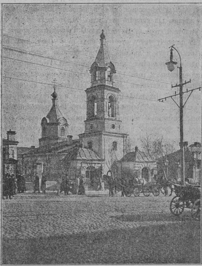
СРЪТЕНСКАЯ (ГЕОРГІЕВСКАЯ) гор. ОРЛА ЦЕРКОВЬ.

БНЫЙ. СТР . . . . . 2063 . . . . . 2064 наго Създа . . . . . 2075 . . . . . 2077 БНЫЙ. мь въ Ор- 01 г. . . . . 2078 миссіонер- . . . . . 2081 миссіонер- . . . . . 2093 . . . . . 2104 . . . . . 2112