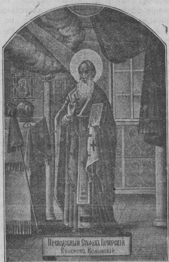
Преподобный Стефанъ Печерскій Епископъ Волынской

И въ разрѣшеніи этого вопроса мы должны выразить свою благодарность нашему земству, которое пришло на помощь церковнымъ школамъ. И здѣсь мы видимъ сочувствіе со стороны его и сочувствіе очень важное. Самый трудный вопросъ о доставкѣ и распредѣленіи матеріала для школы — оно беретъ на себя.