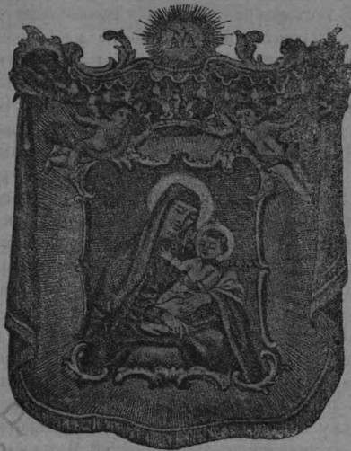
Чудотворная Икона Божіей Матери въ м. Боруняхъ, Ошмянск. у., Вил. г. (По изображенію 18-го вѣка).

Священное изображеніе Богоматери на св. Борунской иконѣ поясное; писано на доскѣ; размѣръ иконы 1 арш. 2 в. × 14 верш. Лѣвая рука Богоматери поддерживаеъ Богомладенца Иисуса, правая—, возлѣ лѣвой, покоится на Его ногахъ; глава Пречистой Дѣвы нѣсколько наклонена къ Ея Возлюбленному Сыну; тихій и умильный взглядъ Ея устремленъ на предстоящихъ; рука у Богомладенца правая протянута впередъ для благословенія. По стилю, контуру и