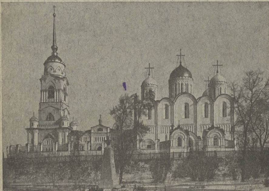
Губ. г. Владимірѣ. СКОРОПЕЧАТНЯ И. КОИЛЬ.