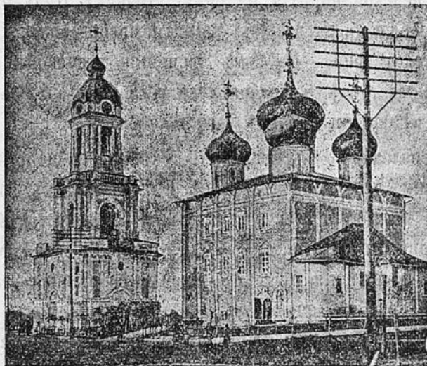
Тверской кафедральный соборъ.