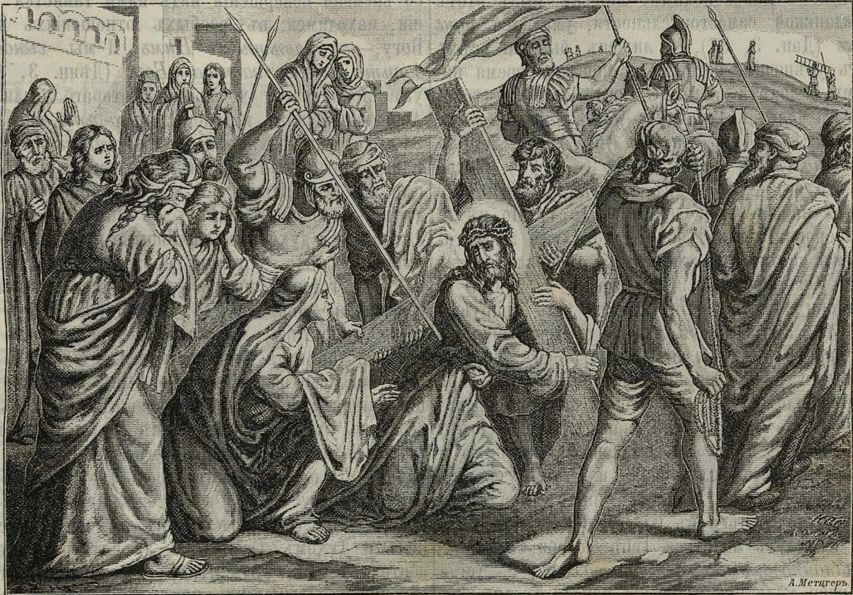
Несеніе креста Господомъ нашимъ Иисусомъ Христомъ.

Гвозди и копіе, которыми Ты изъязвленъ ради любви къ намъ, да будутъ вонзены въ сердца наши, чтобы мы возлюбили Тебя, Господи! Язвы Твои да научатъ