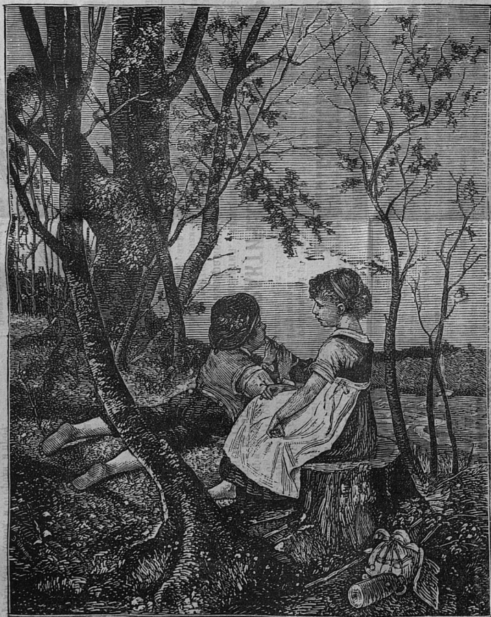
Сельская сценка—«ЮНЫЕ МЕЧТАТЕЛИ». Ширина 9 3 / 4 вер. Высота 12 1 / 4 верш. Продажная цѣна 4 р.