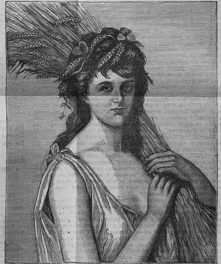
Женская головна—«РУФЬ». Ширина—10 3 / 4 верш. Высота 13 1 / 2 верш. Продажная цѣна 4 р.

Художественное и великолѣпное исполненіе этихъ картинъ во всемірно-извѣстныхъ олеографическихъ засѣденіяхъ Еггста и Овена въ Нью-Йоркѣ, не даетъ возможности отличить ихъ отъ картинъ писанныхъ масляными красками ручнымъ способомъ, вслѣдствіе чего онѣ могутъ служить лучшимъ украшеніемъ любой гостиной.