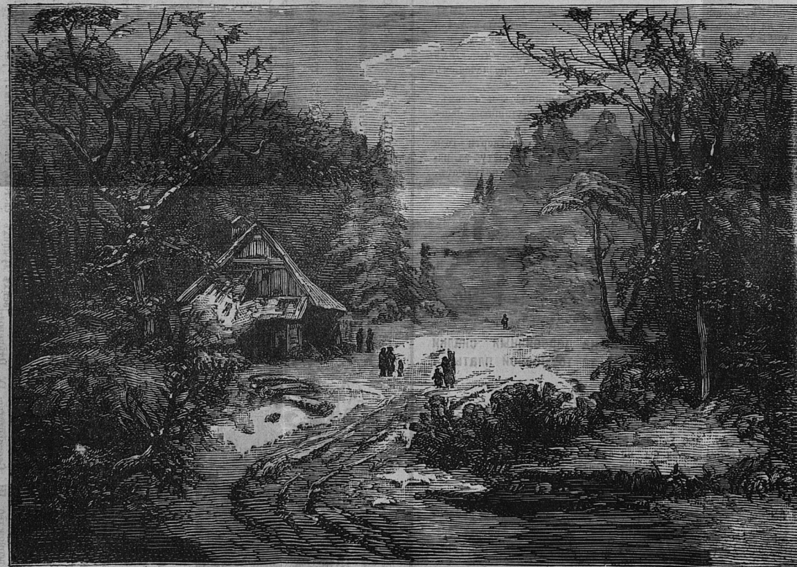
Пейзажъ—«КУЗНИЦА ВЪ ЛѢСУ». Ширина 16 вер. Высота 12 верш. Продажная цѣна 4 р.