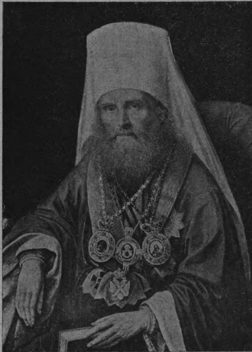
Митр. Московскій Филаретъ, редактировавшій освободительный манифестъ.

Проникнутые стремленіемъ затормозить дѣйствія освободительнаго манифеста, польскіе дворяне прежде всего всѣми мѣрами стараются скрыть отъ крестьянъ манифестъ, или по крайней мѣрѣ затемнить Мѣстное Положеніе.