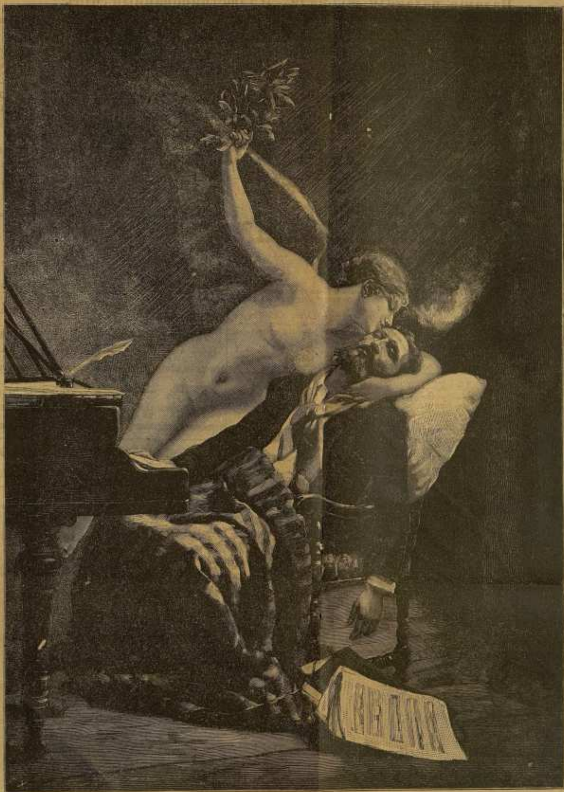
СЛАВА. Съ картины І. А. Ривсана. (Помѣщено въ „Иллюстрирован. Мирѣ“).