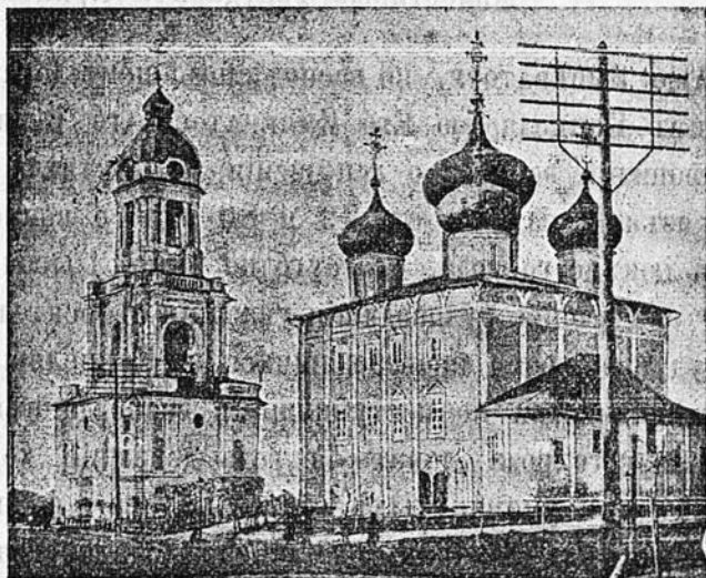
Тверской кафедральный соборъ.

Выходятъ еженедѣльно ПО ПОНЕДѢЛЬНИКАМЪ. Годовая цѣна: