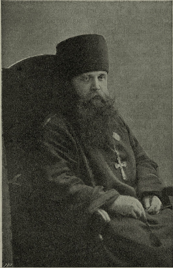
НОВЫЙ ВИКАРІЙ ХЕРСОНСКОЙ ЕПАРХІИ Новонарекаемый Преосвященный Флексій ЕПИСКОПЪ НИКОЛАЕВСКІЙ.