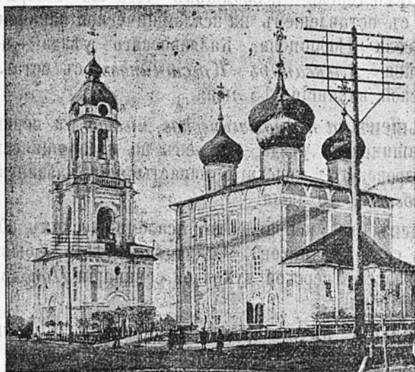
Тверской кафедральный соборъ.