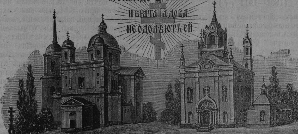
ХР. СВ. ДУХА