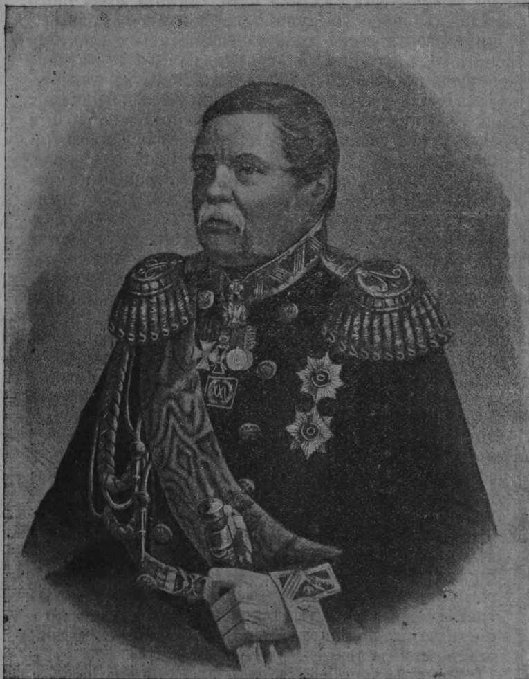
Гр. М. Н. Муравьевъ, устроитель поземельнаго общественнаго быта крестьянъ С.-З. края.

такой безучастности правительства къ безземельнымъ крестьянамъ Сѣверо-Западнаго края, въ то время какъ всѣ крестьяне въ остальной Россіи получили земельные надѣлы, нельзя не видѣть тайнаго вліянія польскаго дворянства, принимавшаго участіе въ составленіи Положенія. Стремясь въ государственныхъ цѣляхъ уничтожить, или по крайней мѣрѣ насколько возможно уменьшить число безземельныхъ, Муравьевъ 17 августа 1863 года издалъ циркуляръ, по которому обезземеленные въ періодъ отъ введенія инвентарей до 1857 года получили участки въ размѣрѣ 3-хъ десятинъ на семью 1) . Послѣдующими циркуля