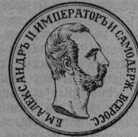
Медали въ память освобожденія крестьянъ 19 февраля 1861 года.