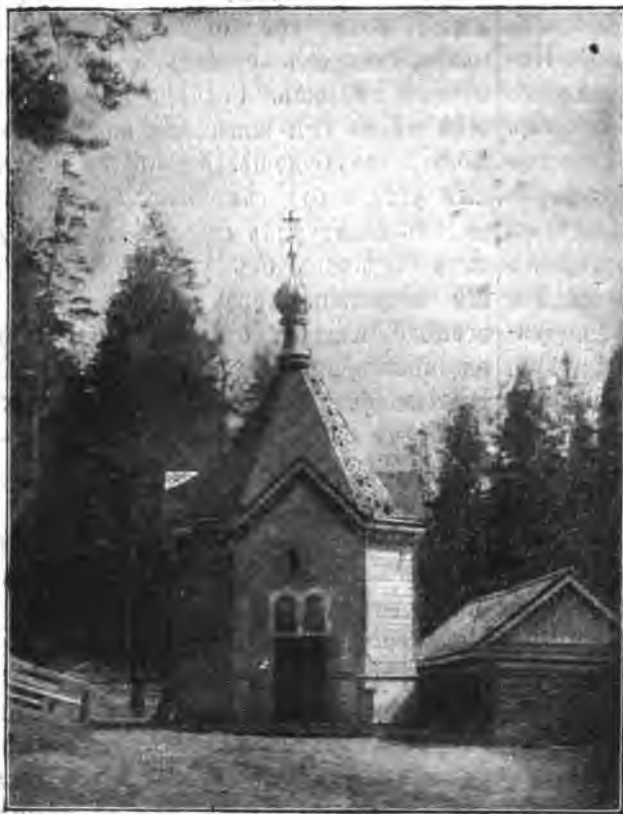
Часовня надъ источникомъ о. Серафима.