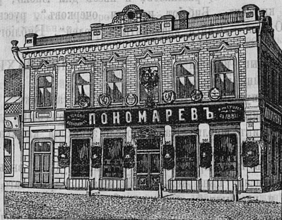
Самара, Дворянская ул. д. Лютеранской церкви.