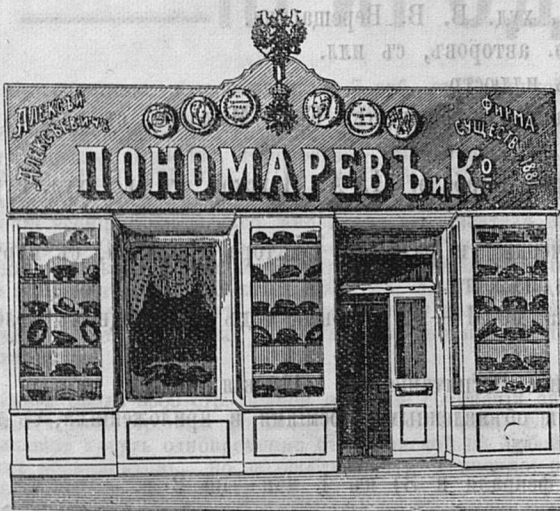
Саратовъ, Никольск. ул. д. Лютеранской церкви.

Принимаются ЗАКАЗЫ на Камилавки и Скуфы.