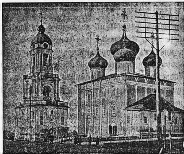
Тверской кафедральный соборъ.