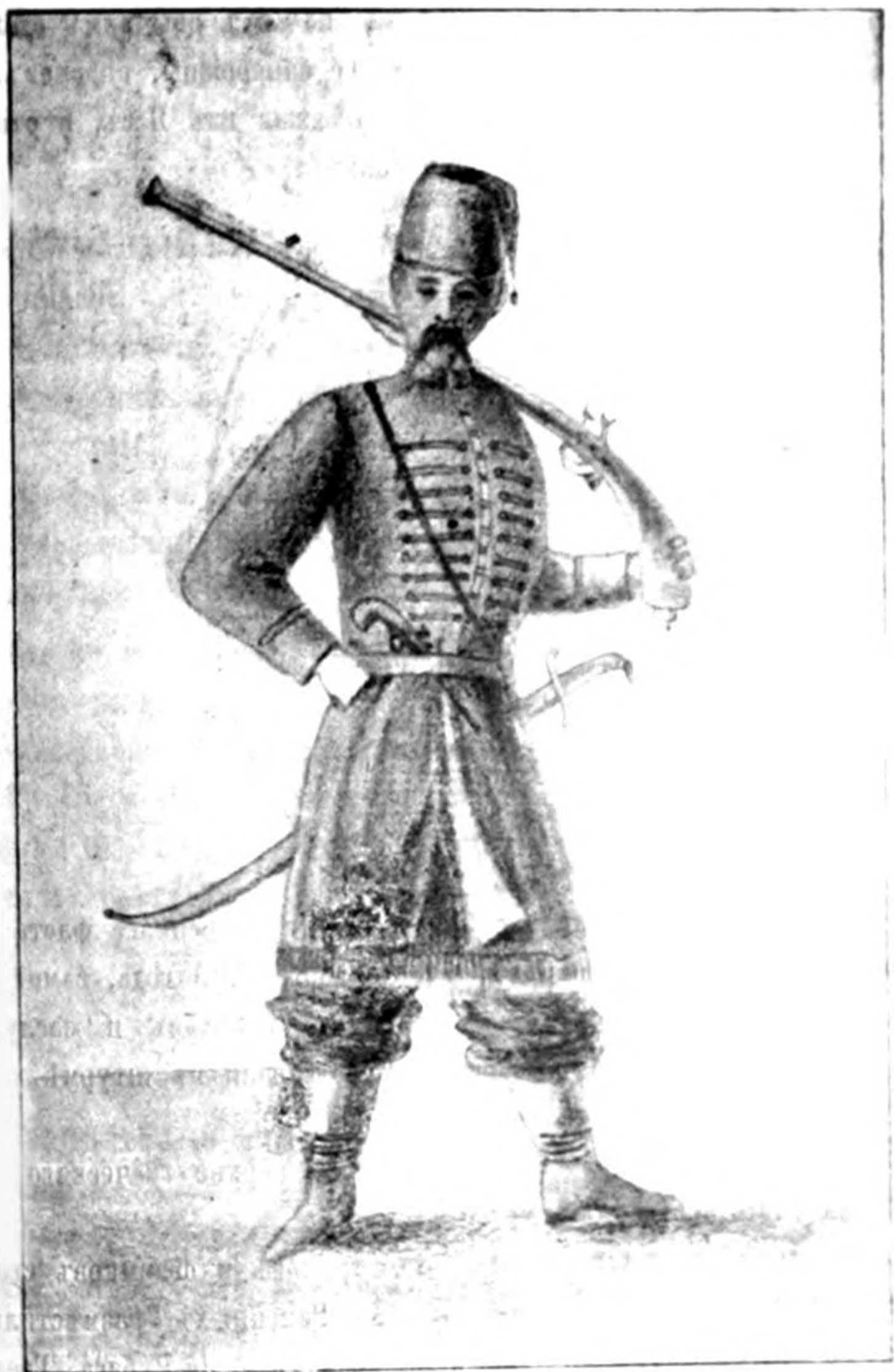
Козакъ Задунайской Запорожской Сѣчи въ 1800 году.

завъ: «видите съ добрымъ человекомъ. ну, мы и пішли. Теперь, княже, нема уже опаски, прибавилъ другой запорожець, турчинова фортеція якъ на ладони. Звелите ваше высокопревосѣтельство и побей